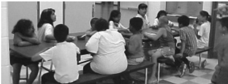
Enfants et jeunes adolescents participant à des activités du Boys and Girls Club.

A u Freight House Boys and Girls Club dans un quartier mal famé du nord de Winnipeg, un épisode étrange s'est déroulé un après-midi de 1999. Un garçon s'est précipité dans le club, a réuni quelques autres gars à l'intérieur et ils sont tous sortis en courant dehors. Quelques instants plus tard, un jeune garçon gisait à terre, mort – coupable d'être vêtu des mauvaises couleurs dans ce quartier infesté de bandes de rue.